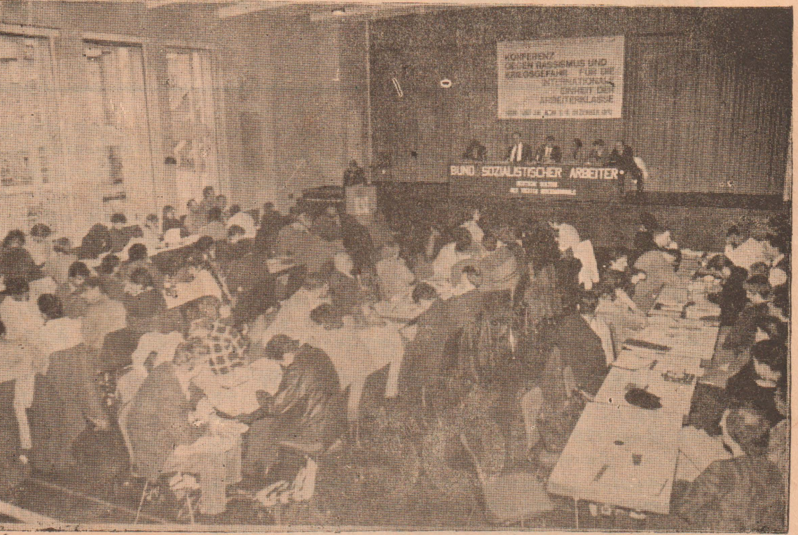
பிராங்பேர்ட்டில் ஜேர்மன் ட்ரொட்ஸ்கிஸ்டுகள் நடாத்திய மாநாடு

இதைத் தொடர்ந்து இடம் பெற்ற கலந்துரையாடலில் 30 பேராளர்கள் இப்பிரச்சினைகளை ஆய்வு செய்தனர். பேச்சாளர்கள் கடந்த 60 ஆண்டுகளுக்கு மேலாக தொழிலாளர் இயக்கத்தில் அதிகம் செலுத்திய ஸ்டாலினிச,