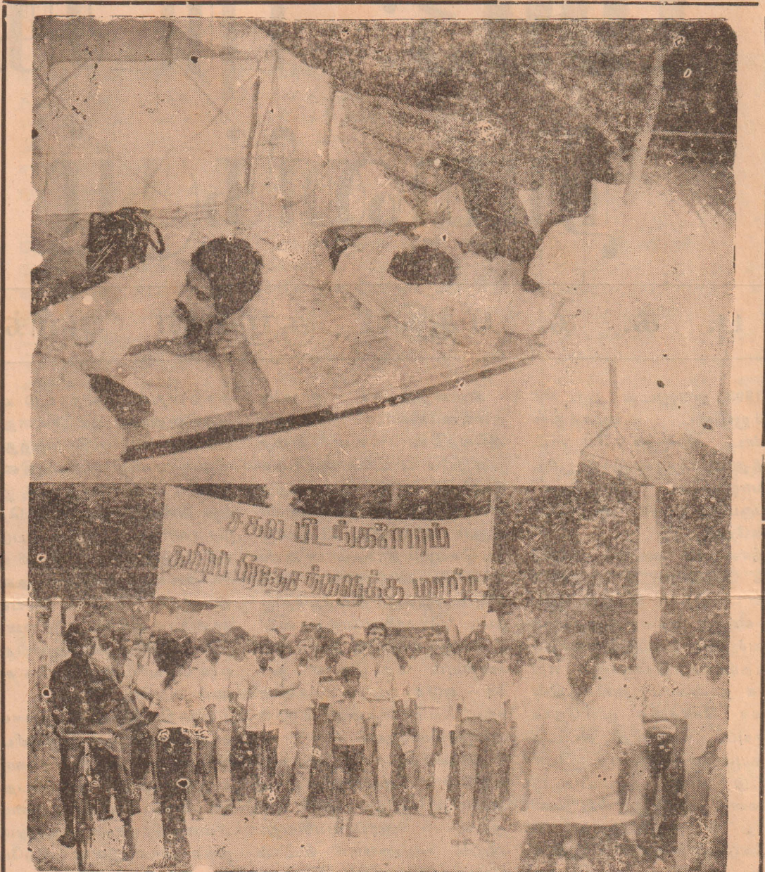
1983 ஜூலை தமிழின படுகொலைகளைத் தொடர்ந்து தமிழ் பல்கலைக் கழக மாணவர்கள் யூ. என். பி. அரசாங்கத்தின் இனவாத தாக்குதல்களுக்கு எதிராக யாழ்ப்பாண பல்கலைக் கழகத்தில் நடாத்திய சாகும்வரை உண்ணா விரதப் போராட்டம்.

இது நான்கு புறத்தில் இருந்தும் மக்களைச் சுற்றிவளை