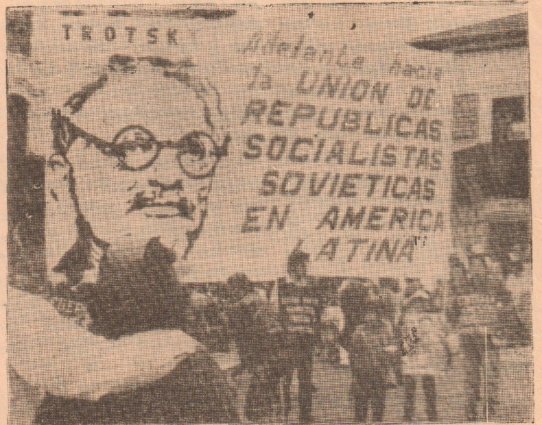
1988ல் ஈக்குவடோர் தலைநகரான குவிட்டாவில் நடைபெற்ற மேதின் ஊர்வலத்தில் 'கொமிட்டி சோசலிஸ்டா' வின் பதாகை

சென்றிருந்தார். அவர் தமது கவிதைத் தொகுதியில் இருந்து ஈக்குவடோர் வலதுசாரி ஜனாதிபதி சிக்ஸ்டோ டிரால் பலனையும் குறிப்பாக ஈக்குவடோர் கலைஞர்களுக்கு எதிரான அடக்கு முறையைக் கண்டனம் செய்யும் கவிதைகளை இசைத்தார். இந்த நிழ்ச்சி முடிவடைந்ததைத் தொடர்ந்து பொவ்டா அவ்விடோ குவிட்டோ என்ற முச்சந்தியில் அவர் பயணம் செய்த ஒரு டாக்கிக்கு அருகே நின்று கொண்டிருந்தார். இக்கட்டத்திலேயே அவர் ஒரு நான்கு சில்லு 'ட்ரூப்பர்' மூலம் மோதப்பட்டார். இந்த மோதல் காரணமாக அவர் சுமார் 10 அடிக்கு அப்பால் தூக்கி வீசப்பட்டதோடு தலையில் படுகாயங்களும் ஏற்பட்டது. அத்தோடு இதன் காரணமாக அவரின் ஈரல் வெடித்தது. இந்த ட்ரூப்பர் கூடவே அவர் பயணம் செய்த டாக்கியையும் மோதிவிட்டு அங்கி