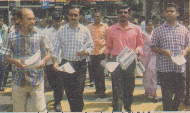
மட்டக்களப்பு மாவட்ட மக்கள் சந்திப்பின் போது

இனவாதத்துக்கு எதிராக துண்டுப்பிரசுரங்கள் விநியோகித்தல்