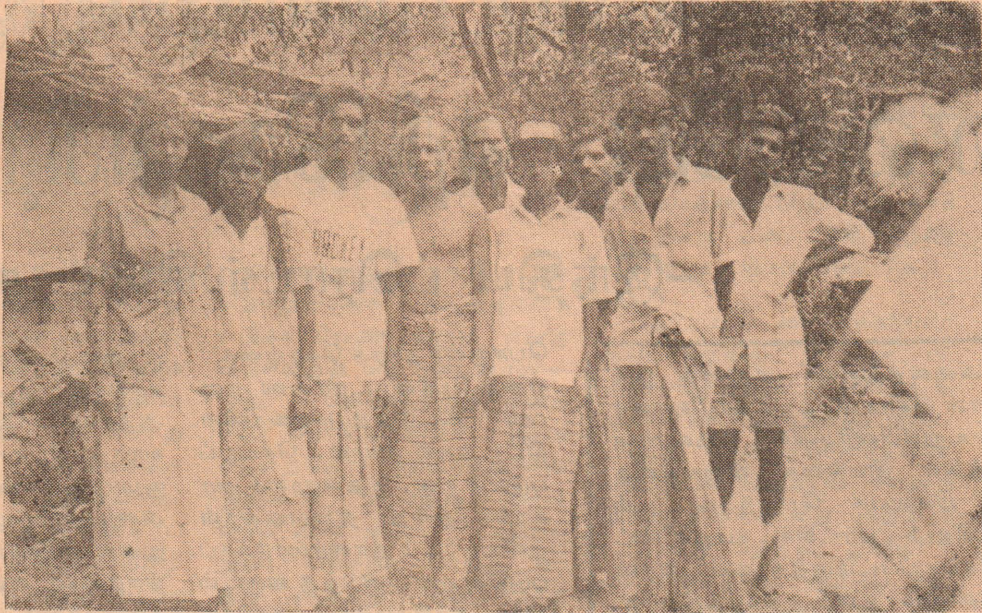
மாத்தளை - பிரே தோட்டத்தில் தாக்கப்பட்ட தொழிலாளர்கள்

பலநாட்கள் மாத்தளை முத்துமாரியம்மன் கோயிலில் தஞ்சம் புகுந்திருந்த இத்தொழிலாளர்கள் தற்சமயம் புகலிடமற்று ரத்தோட்டை நிகலோவ் தோட்டத்தின் பாழடைந்த வயன் காம்பரா இரண்டில் அடைபட்டு சிவிகின்றனர். ஒரு மாத காலம் மட்டுமே இங்கு தங்க அனுமதி கிடைத்துள்ளது. இந்த இடத்திலிருந்தும் வெளியேற