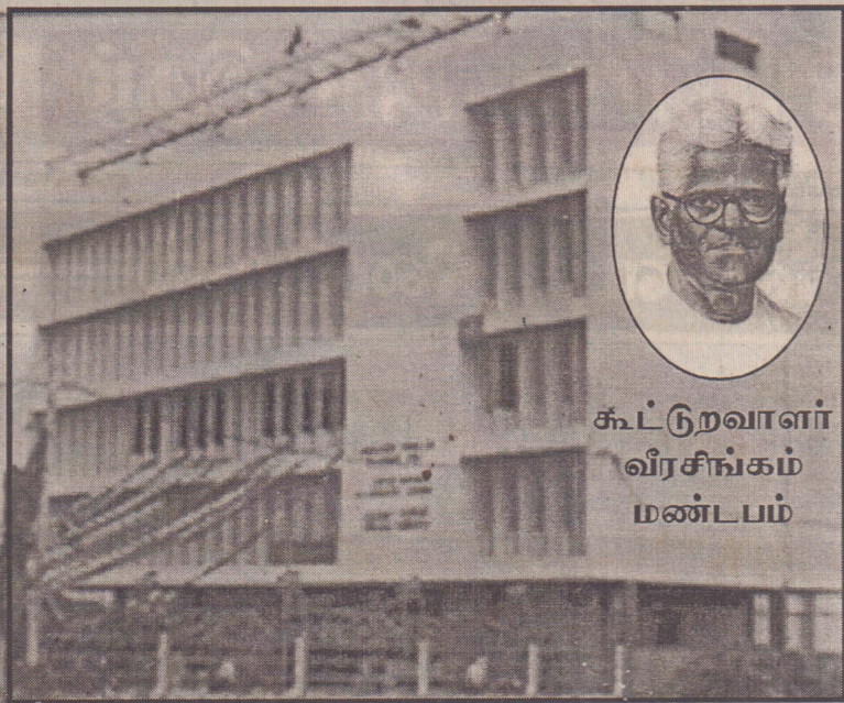
கூட்டுறவாளர் வீரசிங்கம் மண்டபம்

வடபகுதிக் கூட்டுறவு இயக்கம் தொடர்பான கூட்டங்கள், வருடாந்த மகாநாடுகள் என்பன ஆரம்பத்திலிருந்து யாழ்.நீகல் படமாளிகை, யாழ். மாநகரசபை மண்டபம், மத்திய கல்லூரி முதலிய இடங்களில் நடைபெற்று வந்தன. கூட்டுறவாளர்களுக்கென அதிலும் மேற்பார்வை சபைக்கென ஓர் கூட்ட மண்டபமும் அதற்கான காரியாலயமும் அமைக்க வேண்டுமென 1962ல் நடந்த கூட்டுறவாளர் மாநாட்டில் தீர்மானிக்கப்பட்டது. மேற்கொண்டு வேண்டியன விரைந்து செய்யப்பட்டு, அப்போது இருந்த கூட்டுறவு ஆணையாளர் அவர்களால் அத்திபாரம் இடப்பட்டு நான்கு மாடிகள் கொண்ட கட்டிட வேலைகள் ஆரம்பமாகி நடந்தன. (இக் கட்டிடம் கட்டவங்கியில் பணம் கடனாக பெற்றிருந்தாலும் கூட்டுறவுச் சங்கங்கள் தங்கள் வருடாந்த