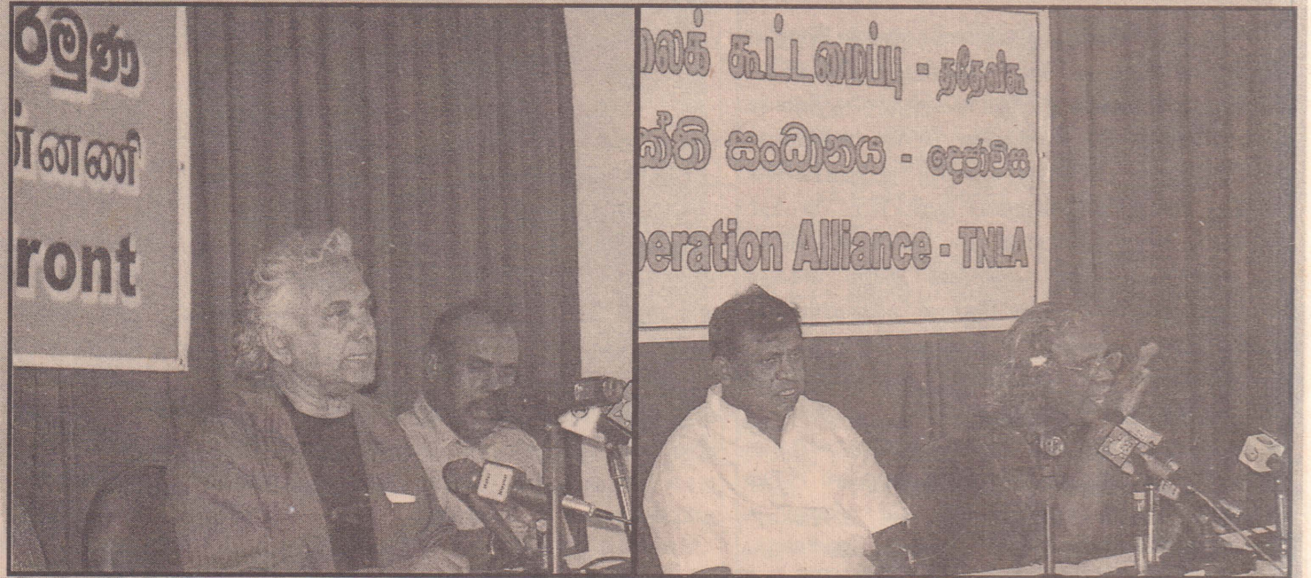
இடதுசாரி விடுதலை முன்னணியும் தமிழ்த் தேசிய விடுதலை கூட்டமைப்பும் நடத்திய ஊடகவியலாளர் மாநாடு

தமிழ் மக்களின் ஆயுதப் போராட்டம் மௌனித்ததன் பின்னர் தமிழ் மக்களின் விடுதலைப் போராட்டத்தை முன்னெடுத்துச் செல்ல வேண்டிய தார்மிக கடமையில் தமிழ்த் தேசியக் கூட்டமைப்பு