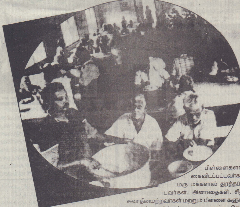
பிள்ளைகளால் கைவிடப்பட்டவர்கள், மரு மக்களால் துரத்தப்பட்டவர்கள், அனாதைகள், சித்த சுவாதீனமற்றவர்கள் மற்றும் பிள்ளைகளுக்கு கஷ்டம்கொடுக்கக் கூடாது என்ற நோக்கத்துடன் வந்தவர்கள் என பல்வேறு காரணங்களுக்காக தமது உறவுகளைவிட்டு வந்த வயோ

வயோதிபர்களை சாந்தி நிலையங்களில் ஒப்படைப்பது என்பது யாராலும் ஏற்றுக்கொள்ள முடியாது. எம்மைப் பெற்றுவளர்த்து ஆளாக்கிய அவர்களை இறுதிநேரத்தில் கைவிடுவது என்பது மிகவும் துரோகமான செயலாகும். அவர்களை இறுதி நேரத்தில் காப்பாற்றியு வேண்டியது ஒவ்வொரு பிள்ளையினதும் தலையாய கடமையாகும். நாமும் இறுதியில் வயோதிபர்களோடும் என்பதை ஒவ்வொரு இளைய சமூகத்தினரும் உணர்ந்து அதன்படி செயற்படுவது சாலச் சிறந்தது.