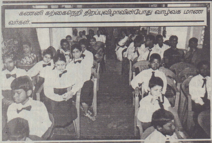
கணனி கற்கைநெறி திறப்புவிழாவின்போது வாழ்வக மாணவர்கள்.