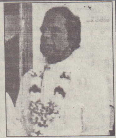
தாக்கு ஏற்றுக்கொள்வேன். மற்றபடி தேவையான சில புதிய பழக்கங்கள் வந்துள்ளன. சில அளவுக்கு அதிகமாக ஆதிக்கம் செலுத்துகின்றன. இருப்பினும் வேண்டாத பல இன்னும் எம்முடன் ஒட்டியுள்ளது அதுவும் மாற வேண்டும்

இம்மாற்றங்கள் எல்லாம் 1983க்கு பிறகு எம்மவர் வெளிநாடு சென்று அங்கு கண்ட கற்றவற்றை இங்கு கொண்டு வந்தனர். பூப்புனிதீர்ப்பு விழா முன்பு வயது முதிர்ந்தவர்கள் முன்னின்று செய்யும் சடங்கு. இன்று பக்கத்து வீட்டு அண்ணா, முன் வீட்டு அக்கா வீடியோ மாமா செய்யும் சடங்காக போய்விட்டது. எனது கருத்தும ஆசையும் ஒன்றுதான். மற்றவரை அடிமைப்படுத்தி, அவமானப்படுத்தி, ஒதுக்கி வைத்து பிரித்துப் பார்த்து சுறண்டி வாழ உறுதுணையாக இருக்கும் எமது கலாசாரத்தில் உள்ள தேவையில்லாத கொள்கைகள், நம்பிக்கைகள், பிடிவாதங்கள் என்று மாறுகின்றதோ அன்றுதான் நான் கலாசாரமாற்ற மடைந்துள்ள