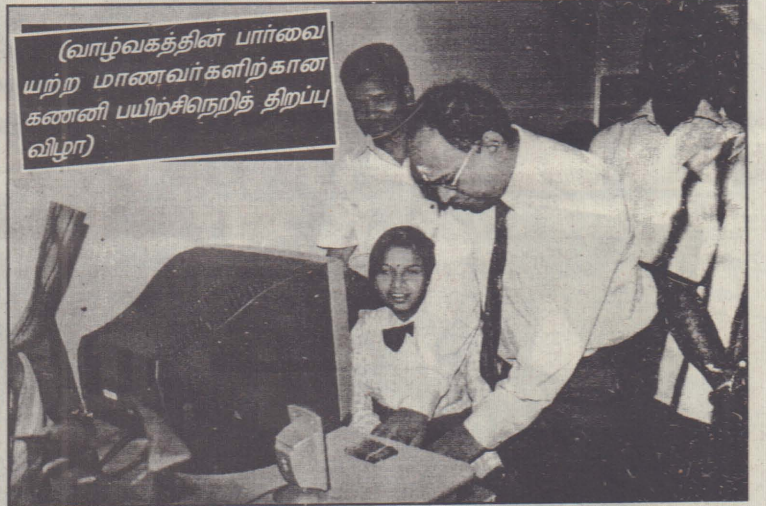
(வாழ்வகத்தின் பார்வையற்ற மாணவர்களிற்கான கணனி பயிற்சிநெறித் திறப்பு விழா)