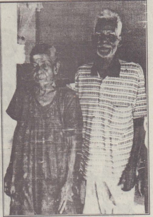
கைதடி முதியோர் இல்லத்திலுள்ள கணவனும் மனைவியும்

எனினும், அங்கு விசேட வைத்தியர் ஒருவர் இல்லாமையானது பல்வேறு சிக்கல்களைத் தோற்றுவித்துள்ளது. சாந்தி நிலையத்தில் உள்ளவர்களில் பலர் இரத்த அழுத்தம் இருத நோய், ஆஸ்தமா, போன்ற உபாதைகளுக்கு உட்பட்டவர்கள். அவர்களுக்கு எந்நேரமும் வைத்திய உதவி தேவைப்படுகின்றது. இந்நிலையில் அங்கு விசேட வைத்தியர் இல்லை என்பது மிகப்பெரிய குறைபாடாக உள்ளது. கைதடி வைத்திய சாலையில் கடமையாற்றும் வைத்தியர் ஒவ்வொரு நாளும் ஒரு மணிநேரம் சாந்தி நிலையத்தில் உள்ளவர்களுக்கு சேவை செய்வார். அவர் இல்லாத