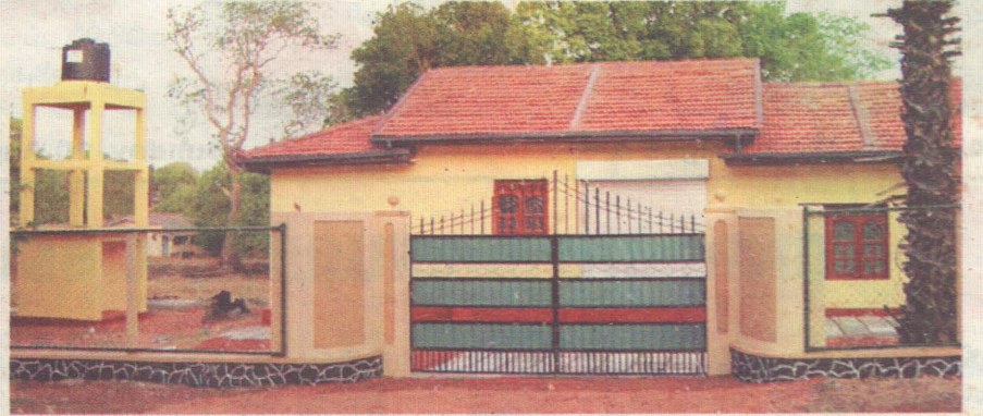
திருகோணமலை உப்பு வெளிப்பிரதேசத்தில் புதிதாக திறக்கப்பட்டுள்ள பாற்பண்ணை

பால் உற்பத்திக்கு தேவையான பசுமாடுகளை கொள்வனவு செய்வதற்கான கடனுதவிகள் மற்றும் பால் உற்பத்தி தொடர்பான தொழில் நுட்ப பயிற்சிகள் என்பனவற்றை இந்த நிறுவனம் விவசாயிகளுக்கு வழங்கியுள்ளது.