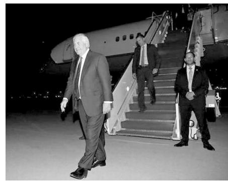
சனும் தீவிரவாதிகளுக்கு எதிரான நடவடிக்கையை பாகிஸ்தான் அதிகரிக்க வேண்டும் என்று கூறியிருந்தது குறிப்பிடத்தக்கது.