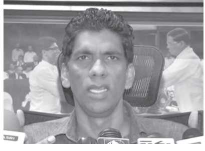
கொழும்பு, ஒக். 27