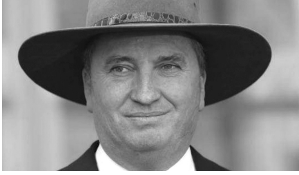
மையுடனேயே போட்டியிட்டதால், அது ஆஸ்திரேலிய அரசியலமைப்புக்கு முரணானது எனக் கூறியே குறித்த ஐவரின் பதவி

இரட்டைக் குடியரிமையுடன் தேர்தலில் போட்டியிட்டதால், பிரதிப் பிரதமர் பாணபி ஜோய்ஸ் உட்பட 5 அரசியல்வாதிகளும் உடனடியாகப் பதவி விலக வேண்டும் என ஆஸ்திரேலிய நீதிமன்றம் அதிரடித் தீர்ப்பு வாங்கியுள்ளது.