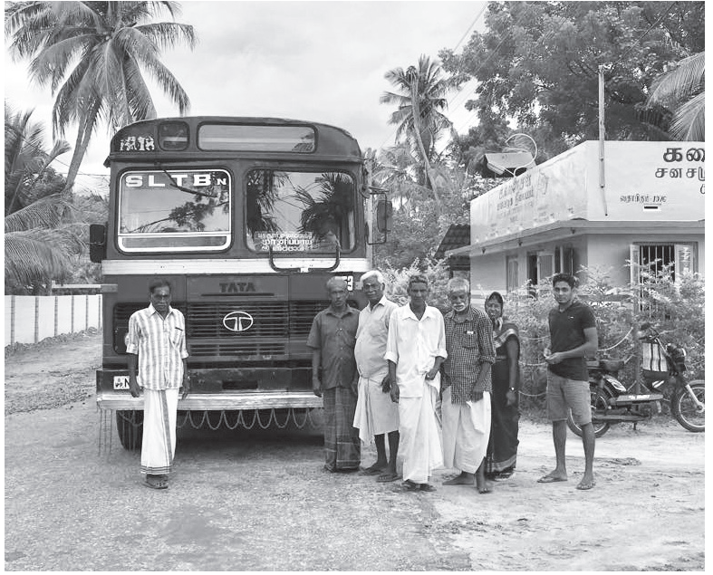
குஞ்சர்கடை, கரணவாய் ஊடாக மானிப்பாய், வட்டுக்கோட்டை வரை பஸ் சேவை நேற்று ஆரம்பிக்கப்பட்டுள்ளது. 753 ஆம் இலக்க பாதைகளின் ஊடாக இந்தப் போக்குவரத்து சேவை தொடர்ந்து நடைபெறும் என குறிப்பிடப்பட்டுள்ளது. (உ)