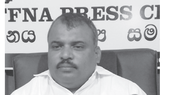
போலவே தற்போது கள் இறக்க தடை எனும் வர்த்தமானி அறிவிப்பு வெளி வந்துள்ளது. இந்தத் தடையை நாம் முற்று முழுதாக எதிர்க்கின்றோம். இந்த தடையால் பாதிக்கப்பட்ட போகின்ற மக்களுக்குக்காக போராடுவோம்” - என்றார். (உ)

யாழ்ப்பாண அமையத்தில் நேற்று நடைபெற்ற ஊடகவியலாளர் சந்திப்பில் கருத்து வெளியிட்ட அவர், “சித்தூள் மரத்துக்கு இல்லாததடை எதற்காக பனை தென்னைக்கு தடை விதிக்கப்பட்டது? இவ்வாறான தடையைக் கொண்டு வருவது தொடர்பில் மாகாண அமைச்சுடன் கலந்த லோசிக்கவில்லை. ஏன் அவ்வாறு கலந்தலோசிக்கவில்லை? புகையிலையை தடை செய்யப்பட்ட போது அந்தத் தொழிலை நம்பி வாழ்ந்த பலருக்கு நஷ்டஈடு கொடுக்கவில்லை மாற்றுத் தொழில் வாய்ப்பு ஏற்படுத்திக்கொடுக்கவில்லை. அதே