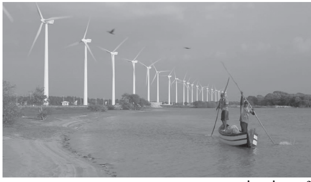
மன்னார், நவ.24 மன்னாரில் காற்றாலை மின்திட்டத்தை அமைக்கவும், 3400 கி.மீ நீளமான கிராமிய வீதிகளை அபிவிருத்தி செய்யவும், ஆசிய அபிவிருத்தி வங்கி 350 மில்லியன் டொலர் கடனுதவியை இலங்கைக்கு வழங்கவுள்ளது.

இதுதொடர்பாக ஆசிய அபிவிருத்தி வங்கிக்கும், நிதியமைச்சுக்கும் இடையில் இரண்டு உடன்பாடுகள் நேற்று முன்தினம் கையெழுத்திடப்பட்டன. 340 கி.மீ நீளமான தேசிய நெடுஞ்சாலையை உள்ளடக்கியதாக, 3400 கி.மீ கிராமிய வீதிகளை தரமுயர்த்துவதற்காக ஆசிய அபிவிருத்தி வங்கி 150 மில்லியன் டொலர் கடனுதவியை வழங்கவுள்ளது. வடக்கு, கிழக்கு, ஊவா மற்றும் மேல்மாகாணங்களில் இந்த வீதி அபிவிருத்தித் திட்டங்கள் நடைமுறைப்படுத்தப்படும். அத்துடன் மன்னாரில் காற்றாலை மின்திட்டத்தை அமைக்க 200 மில்லியன் டொலர் கடனுதவியையும் ஆசிய அபிவிருத்தி வங்கி வழங்கவுள்ளது. இந்தத் திட்டத்தின் கீழ் மன்னார் தீவில் 100 மெகாவாட் உற்பத்தி திறன் கொண்ட காற்றாலைப் பண்ணை அமைக்கப்படவுள்ளது. 256.7 மில்லியன் டொலர் செலவிலான இந்தத் திட்டத்துக்கு ஆசிய அபிவிருத்தி வங்கி, 200 மில்லியன் டொலரை கடனாக வழங்கவுள்ளது. எஞ்சிய 56.7 மில்லியன் டொலரை இலங்கை மின்சாரசபை முதலீடு செய்யும். (அ)