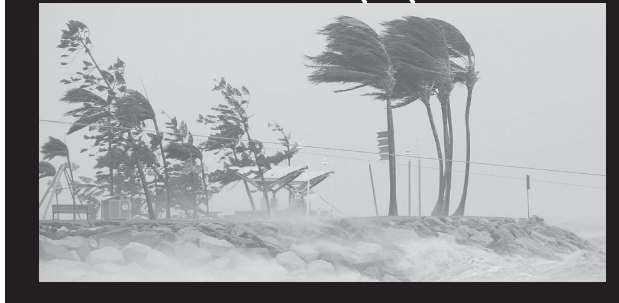
மன்னார், நவ.24 மன்னாரில் காற்றாலை மின்திட்டத்தை அமைக்கவும், 3400 கி.மீ நீளமான கிராமிய வீதிகளை அபிவிருத்தி செய்யவும், ஆசிய அபிவிருத்தி வங்கி 350 மில்லியன் டொலர் கடனுதவியை இலங்கைக்கு வழங்கவுள்ளது.

கொழும்பு, நவ.24 தென்மேற்கு வங்காள விரிகுடாவில் உருவாகி வரும் புயலினால் இலங்கையும், தமிழ்நாட்டின் தெற்கு கரையோரப் பகுதிகளும் அடுத்தவாரம் கடுமையான பாதிப்புக்களைச் சந்திக்கக் கூடும் என்று அமெரிக்க காலநிலை முன்னறிவிப்பு மையம் தெரிவித்துள்ளது. வார இறுதியில் இருந்து இந்தப் புயலின் தாக்கத்தை எதிர்கொள்ளும் நிலை ஏற்படும் என்றும் தெரிவிக்கப்பட்டுள்ளது. டிசெம்பர் 28ஆம் திகதி வரை கடுமையான மழை இலங்கையிலும், தென்னிந்தியாவின் கரையோரப் பகுதிகளிலும் பெய்யும் என்றும் அமெரிக்க காலநிலை முன்னறிவிப்பு மையம் தெரிவித்துள்ளது. (அ)