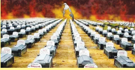
யாழ்ப்பாணம், நவ. 24

வடக்கு மாகாண சபையின் நேற்றைய அமர்வில் மாவீரர்களுக்கு அஞ்சலி செலுத்தும் நிகழ்வுகள் வேண்டாம் 06