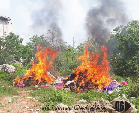
விரிவான செய்திக்கு 06