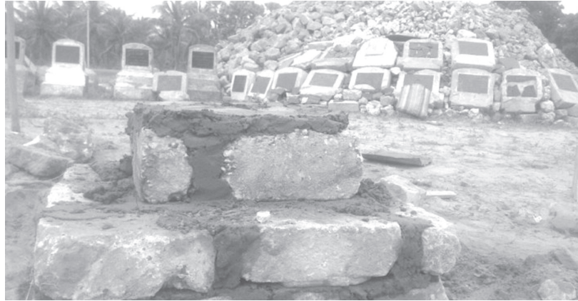
கிளிநொச்சி, நவ. 27 கிளிநொச்சி, கனகபுரம் மாவீரர்