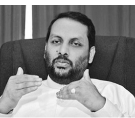
யப்பட்டுள்ளது. கடற்றொழில் நீரியல் வள அமைச்சர் என்ற ரீதியில் ஐக்கிய நாடுகள் சபையின் அபிவிருத்திப் பிரிவிடம் முன்வைத்த கோரிக்கைக்கு அமைவாக இதற்கான திட்டம் முன்னெடுக்கப்பட்டுள்ளது” எனவும் அவர் தெரிவித்தார். (அ)

“இது தொடர்பாக ஐக்கிய நாடுகள் சபையுடன் நடத்தப்பட்ட பேச்சுவார்த்தை வெற்றியடைந்துள்ளது. குளங்களில் நீர்வாழ் உயிரினங்களை அபிவிருத்தி செய்வதற்காக இம்முறை வரவு-செலவுத்திட்டத்தில் 25 மில்லியன் ரூபா ஒதுக்கீடு செய்யப்பட்டுள்ளது.