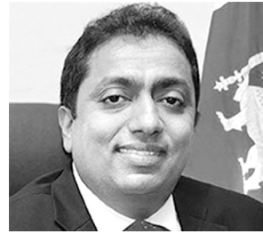
பந்துல குணவர்த்தன வாய்மூலம் முன்வைத்த கேள்வி ஒன்றுக்கே

தகவல் தொழில்நுட்பப்பாடத்தைப் போதிப்பதற்கான ஆசிரியர்கள் பயிற்றுவிக்கப்படுவார்கள். இவ்வாறான ஆசிரியர்களை ஊக்குவிப்பதில் கவனம் செலுத்தப்பட்டிருப்பதாக கல்வி அமைச்சர் அகிலவிராஜ் காரியவசம் நாடாளுமன்றத்தில் நேற்றுத் திங்கட்கிழமை தெரிவித்தார். நாடாளுமன்ற உறுப்பினர்