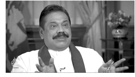
பட்டுள்ளதாக கொழும்பு ஊடகம் ஒன்று சுட்டிக்காட்டியுள்ளது. 2014-07-15 திகதியில் 1871/18 என்ற இலக்க வர்த்தமானியின் ஊடாகவே குறித்த மூவரும்

2014-07-15 திகதியில் 1871/18 என்ற இலக்க வர்த்தமானியின் ஊடாகவே குறித்த மூவரும்