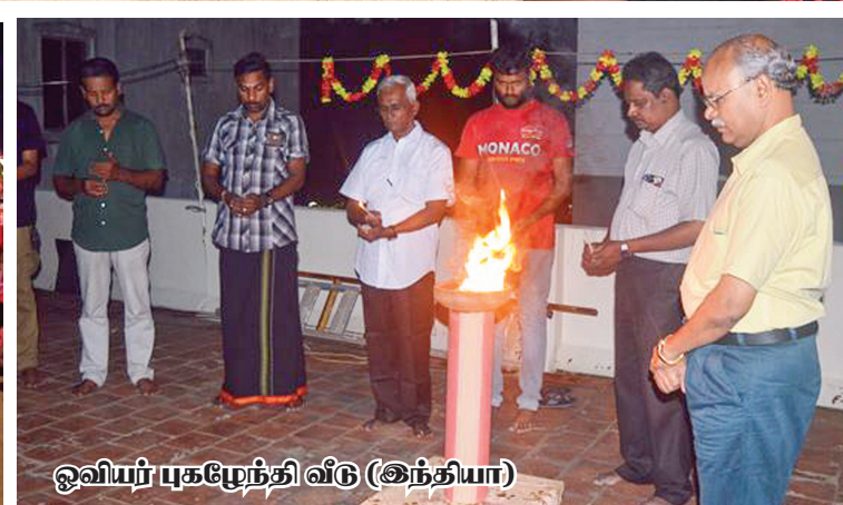
ஓவியர் புகழேந்தி வீடு (இந்தியா)