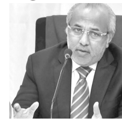
படுத்த வேண்டும். இந்நிலையை ஏற்படுத்தச் சட்டத்தின் மூலம் நாம் செயற்படவேண்டும்” என்று அமைச்சர் மேலும் தெரிவித்தார். (அ)

சர்வதேச ரீதியிலும் இலங்கை என்ற ரீதியிலும் பெண்களின் உழைப்பு சக்தி மிகவும் முக்கியமானதென்று நகரத்திட்டமிடல் மற்றும் நீர்வழங்கல் அமைச்சர் ரவூப் ஹக்கீம் நாடாளுமன்றத்தில் நேற்றுத் திங்கட்கிழமை தெரிவித்தார். “இலங்கையில் பெண்களுக்கான சந்தர்ப்பம் தற்போது அதிகரிக்கப்பட்டுள்ளது. இவர்களுக்கு அரசியலில் ஈடுபடுவதற்கு சந்தர்ப்பம் உண்டு. உலகளாவிய ரீதியிலும், இலங்கை என்ற ரீதியிலும் பெண்களின் உழைப்பும் ஒத்துழைப்பும் மிகவும் முக்கியமானதாகும். மகளிர் படைப்பணிக் சக்தி மிகவும் முக்கியமானதாகும். ஆகவே பெண்களுக்காகச் சிறந்த சேவையை மேற்கொள்ளக்கூடிய இடங்களை மேம்படுத்த வேண்டும். இந்நிலையை ஏற்படுத்தச் சட்டத்தின் மூலம் நாம் செயற்படவேண்டும்” என்று அமைச்சர் மேலும் தெரிவித்தார். (அ)