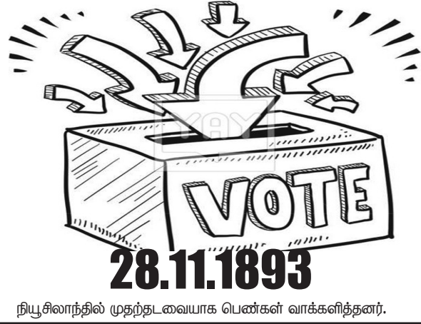
நியூசிலாந்தில் முதற்தடவையாக பெண்கள் வாக்களித்தனர்.