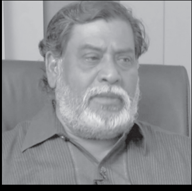
கொழும்பு, டி.செ. 09 வடக்கு, கிழக்கு மாகாண முன்னாள் முதலமைச்சரும், ஈ.பி.ஆர். எல்.எம். பத்மநாப அணியின் முக்கியஸ்தருமான அ.வரதராஜப்பெருமா

ளுக்கு இலங்கைக் குடியரிமை மீள்வும் வழங்கப்பட்டுள்ளது.