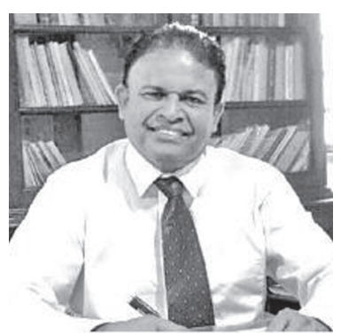
ஊழியர்களையும் கடமைக்கு சமூகமளிக்கமாறு ரயில்வே முகாமையாளர் கோரியுள்ளார்.