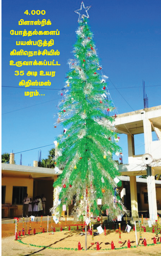
4,000 பிளாஸ்டிக் போத்தல்களைப் பயன்படுத்தி கிளிநொச்சியில் உருவாக்கப்பட்ட 35 அடி உயர கிறிஸ்மஸ் மரம்...

ளிகள் கட்சியின் உறுப்பினர்கள் இலங்கைத் தமிழரசுக் கட்சியின் ஊடாக வேட்பாளர்களாக அறிவிக்கப்பட்டுள்ளனர். இதனால் இத்தேர்தலில், தமிழ்த் தேசியக் கூட்டமைப்புக்கு ஆதரவாக ஐனநாயகப் போராளிகள் கட்சி பிரசாரத்தில் ஈடுபடும் எனவும் கூறப்பட்டது. இலங்கைத் தமிழரசுக் கட்சியின் தலைமை அலுவலகத்தில் அக்கட்சியின்துணைப் பொதுச் செயலர் சீ.வீ.கே. சிவஞானம், 06▶