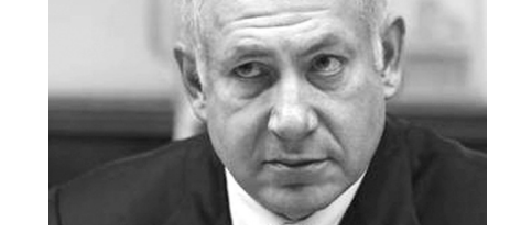
எதிர்காலத்திலும் தலைநகராக விளங்கும். இதில் எந்த மாற்றமும் இல்லை" என்றார். (இ)

இந்த நிலையில், ஐ.நா. தீர்மானத்தை இஸ்ரேல் திட்டவாத்தமாக நிராகரித்தது. இது குறித்து இஸ்ரேல் பிரதமர் பெஞ்சமின் நேதன்யா "ஐ.நா.வில் கொண்டு வரப்பட்ட தீர்மானத்தின் மீதான வாக்கெடுப்பில் பங்கேற்காமலும், தீர்மானத்தை எதிர்த்தும் வாக்களித்த நாடுகளுக்கு நன்றி தெரிவித்துக் கொள்கிறேன். அந்தத் தீர்மானத்தை ஏற்றுக்கொள்ள முடியாது. கடந்த காலங்களில் ஜெருசலேம் இஸ்ரேலின் தலைநகராக இருந்தது.