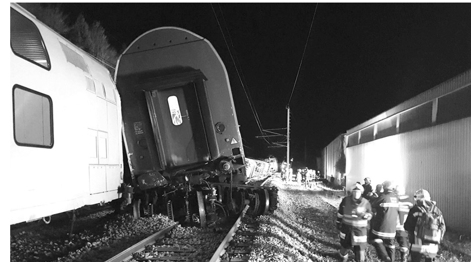
ஓஸ்திரியாவில் ரயில்கள் நேருக்கு நேர் மோதிக்கொண்டதில் பயணிகள் பலர் காயமடைந்தனர்.

ஓஸ்திரியாவின் தலைநகரான வியன்னாப் பகுதியிலிருக்கும் ரயில் நிலையத்துக்கு அருகில் இரண்டு ரயில்கள் நேருக்கு நேர் மோதிக்கொண்டதில் 15 இற்கும் மேற்பட்டோர் காயமடைந்திருப்பதாகவும், இதில் 6 பேர் மிகவும் ஆபத்தான நிலையில் உள்ளதாகவும் அறிவிக்கப்பட்டுள்ளது. இந்தச் சம்பவத்தை அறிந்து 30 அம் புலன்ஸ், இரண்டு ஹெலிகொப்டர் என்பவற்றுடன் விரைந்து சென்ற பொலிஸார் பாதிக்கப்பட்டவர்களை உடனடியாக மீட்டு மருத்துவமனைக்கு அனுப்பி வைத்தனர்.