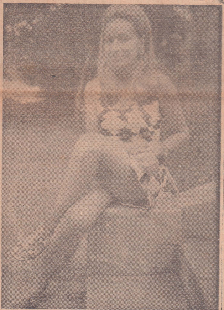
பார்ப்போரை மதிமயக்கும் இந்த மாடல் அழகி இத்தாலிய சேர்ந்தவர். நாட்டைச் சேர்ந்தவர்.

"இரண்டாவது சந்தேக நபரான தனது நண்பரின் உதவியை அவர் நாடினார். கொள்ளை நாடகம் ஒன்றை நடத்தவதன் மூலம் கடன்தாரர்களின் தொல்லையில் இருந்து விடுபடலாம் என்று இவரின் நம்பிக்கை. ஆனால் இந்த நாடகத்துக்கு உந்தையாக இருந்த இரண்டாவது சந்தேக நபர் பொலீஸில் சிக்கியபடியால் உண்மை வெளியாயிற்று. முறைப்பாட்டுக்காரரும் பின்னர் உண்மையை அவிழ்த்து விட்டார். இதற்கு மேலும் பொலீஸார் சம்மர் விடுவார்களா? பொய்யான முறைப்பாடு செய்ததாக முறைப்பாட்டுகாரர் மீது வழக்குத் தொகுர, உள்ளனர். (5)