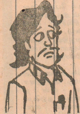
சொகுசு தேடி போன வையளுக்கு 'ஷொக்' அடிக்கிற செய்தி...

ஸ்ரீலங்கா கடற்படை சூடு! இந்திய மீனவர் மரணம்!!