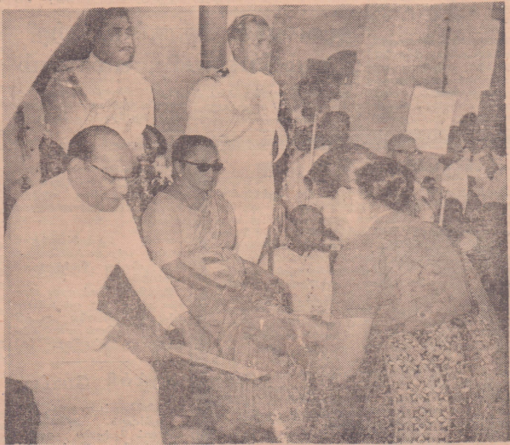
புத்தம மந்திரி திருமதி ஸ்ரீமத்வேர பண்டார நாயக்கா சிம்மாசனப் பிரசங்கம் மந்திரி திருமதி ஸ்ரீமத்வேர பண்டார நாயக்கா சிம்மாசனப் பிரசங்கம் பதி திரு. வில்லியம் கோபல் லாவரலிடம் கையளிக்கிறார்.