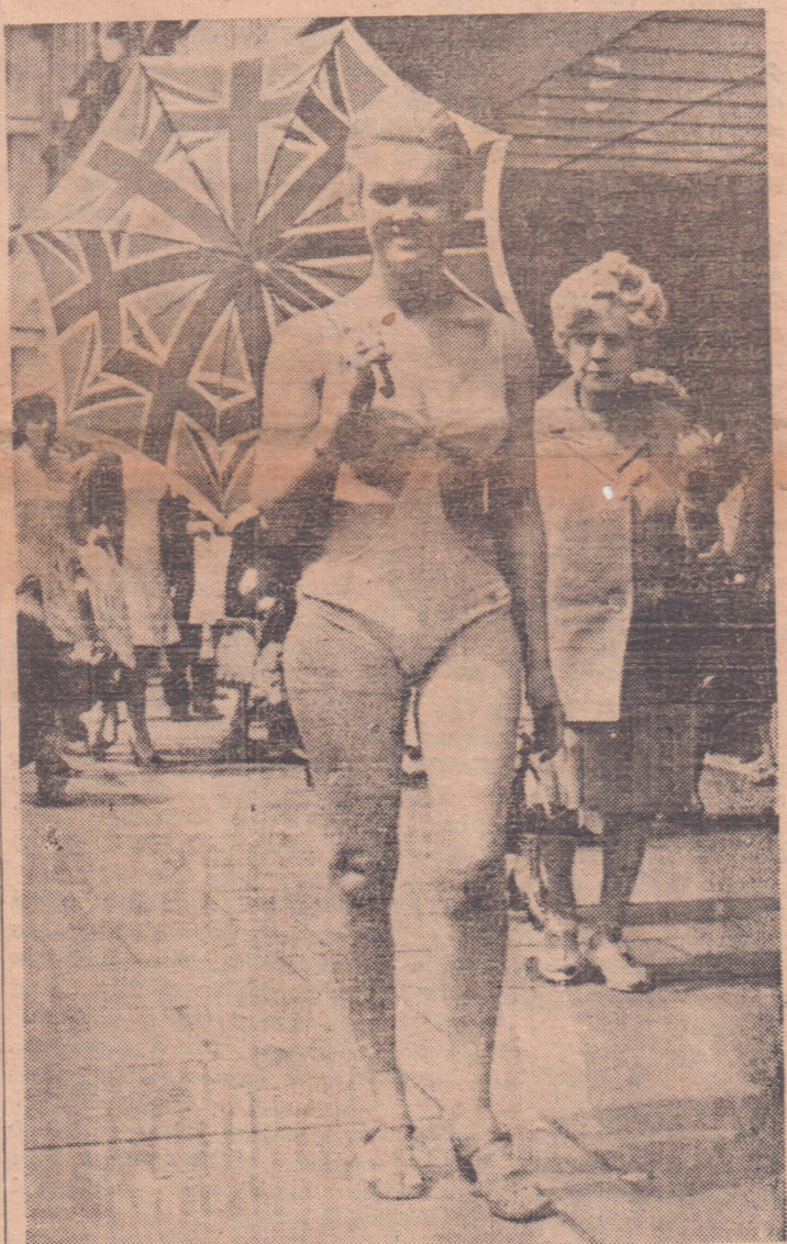
தூடு அதிகம் என்றால் அதைத் தணிப்பதற்குப் பல வழிகள் உண்டு. தளதள வென்று வளர்ந்த உடலில் திறந்த ஆடை அணிந்து இளை தென்றல் கொஞ்சி விளையாட்டிடாமலித்து துட்டைத் தணிக்கிறுள் இங்கிலாந்து அழகு ராணி செல்வி ஈஷோள் ஓர்மல்.

பதினெந்து நாட்கள் தொடர்ந்து நடைபெறும் இவ்விழாவில் கலந்து கொள்ள பெருந்திரளான பக்தர்கள் கூட்டம் திரள்கிறது. (15)