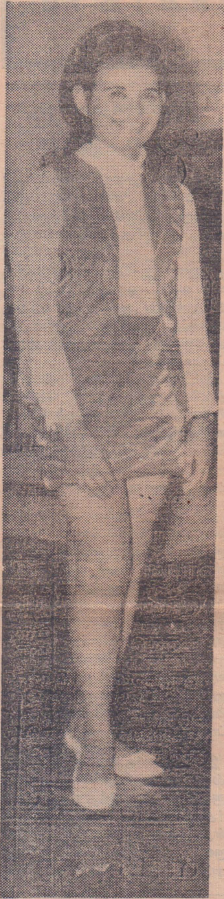
உள்ளூர் மேரஸ்தர் உலகில் துண்களை தனிப் புகழ்பெற்றுள்ள அழகி ஆன், மினி உடைகளை விரும்பி அணிகிறார்.