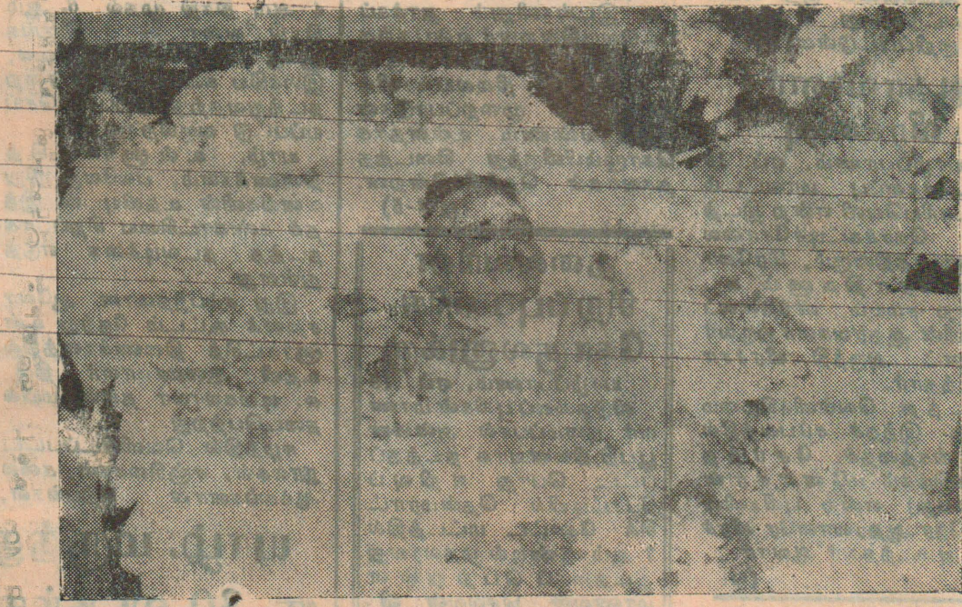
ஈழத் தமிழர்களின் நெஞ்சங்களில் நிரந்தர இடம்பிடித்துவிட்ட அன்னை பூபதி, தாயகத்தின் விடுதலைக்காகத் தன்னை ஆகுதியாகிய சின்னர் மலர்ப் படுக்கையில் ஆணர்ந்தமாக வீளாத் துயில்கொள்ளும் காட்சி இது. சரியாக ஐந்து வருடங்களுக்கு முன்னர் எடுக்கப்பட்ட படம்.

எனவே இத்தகைய தற் கொடையாளி அன்னை பூப தியை நினைவு கூரும் இப் புனித நாளில் எமது விடு தலைப் போராட்டத்தில் தமக்குள்ள தேசியக் கட மைபை உணர்ந்து அனைத் துத் தமிழீழப் பெண்களும் அணி திரண்டு போராட் டத்தை முனைப்புடன் முன் நெடுக்க உறுதிபூனை வேண்டும்.