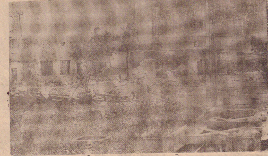
படையினர் கிளிநொச்சியைக் கைப்பற்றிய பின்னர் காணப்படும் கிளிநொச்சி நகரம்.

★ ஒன்றோடு ஒன்று தொடர்புபட்டதாக உள்ள முகாம்களைப் போலல்லாமல்