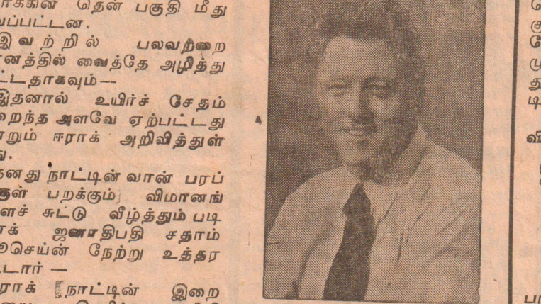
சில் கிளின்டன் இருந்தன - ஈராக்கின் இந்த நட (6 ஆம் பக்கம் பார்க்க)