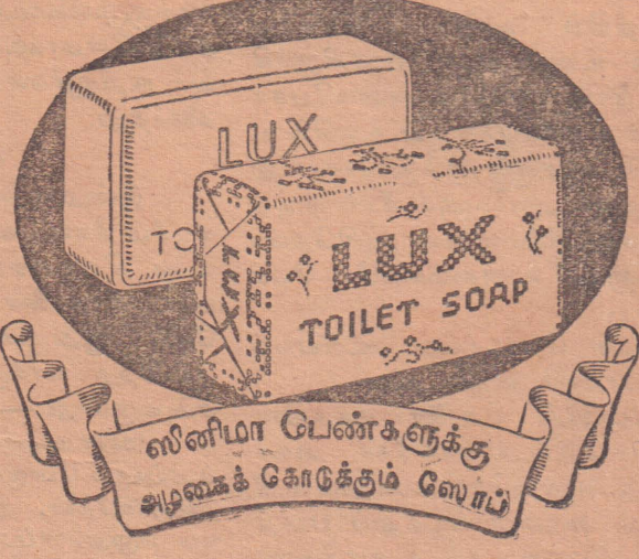
வ்லினிமா பெண்களுக்கு அழகைக் கொடுக்கும் ஸோப்

லக்ஸ்டொய்லெட் ஸோப் மிகவும் சுத்தமான சாமான்களிலிருந்து தயாரிக்கப்பட்டது. ஒவ்வொரு கட்டியையும் அதன் இன்பமான வாசனையைக் காப்பதற்கு காதித்தலைப் பொதியப்பட்டிருக்கிறது. இன்றே மேற் சொன்ன லேசான அழகு உண்டாக்கும் வழியை கைக்கொள்ளுங்கள்.