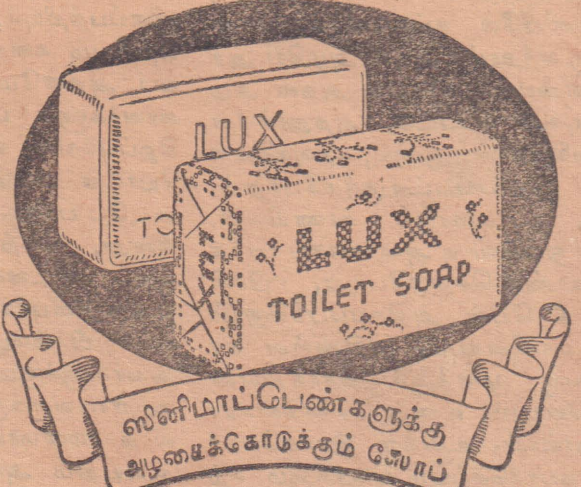
ஸினிமாப்பெண்களுக்கு அழகைக்கொடுக்கும் ஸோப்

ஜின்ஜர் ரோஜர்ஸ் என்ற வரினிமா ஸ்டார் லக்ஸ்டொய்லெட் ஸோப்பைப்பற்றி சொல்லுவதை வாசித்தீர்கள். ஹோலிவுட்டிலும், இங்கிலாந்திலும் உள்ள 857 பிரபல வரினிமா நடிக்கைகளில் 846 பேர்கள் இவ்விதமாகவே கருதுகிறார்கள். மாசற்ற அழகைப் பாதுகாக்கும் குணம் லக்ஸ்டொய்லெட் ஸோப் ஒன்றிற்கே உண்டு என்பதைக் கண்டு அதையே அவர்கள் உபயோகிக்கிறார்கள். லக்ஸ்டொய்லெட் ஸோப்பின் வெண்மையான நுரையிருதுவாய் சுத்திசெய்வதுடன் சருமத்தின் மேலிலும் மயிர்க்கண்களினிடையிலும் படிந்துள்ள எல்லா அழுக்குகளையும் அறவே நீக்கி தேகத்தை சோபிக்கச் செய்கிறது. வரினிமா நடிக்கைகள் அனுபடிக்கும் லேசான இவ்வழகுபடுத்தும் முறையை நீங்களும் அனுசரித்து ஆனந்தமடையலாம். லக்ஸ்டொய்லெட் ஸோப் ஒரு கட்டி இன்று வாங்கி அதனால் உங்கள் தேக சருமத்திற்கு ஏற்படும் விசேஷ குணத்தை நீங்களே மனதார உணருங்கள்!