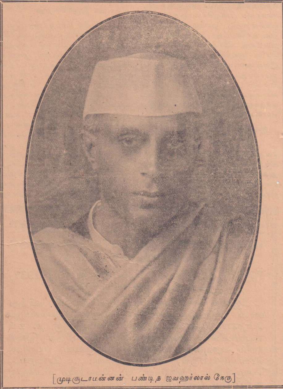
[முடிசூடாமன்னன் பண்டித ஜவஹர்லால் நேரு]

சிலவிஷயங்களை நான் சொல்ல விரும்புகிறேன். அவைகளை நான் மிகப் பிரதானமானவையாகக் கவ னிக்கிறேன். இந்தியர் சாதாரண சுதந்தரங்களை இழந்துவிட்டார்கள ளென்பது எனது மனதைப் புண படுத்துகிறது. புதிய அடக்குமு றைச் சட்டங்களை உண்டாக்கி எத் (தொடர்ச்சி அடுத்த பக்கம் பார்க்க)