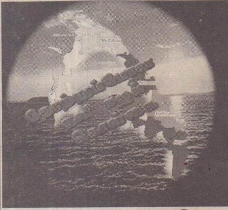
புலிகள் தொடர்பான இந்திய அதிகாரிகளின் நிலைப்பாடு.