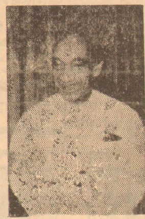
தம் என்றால் யுத்தம், சமாதானம் என்றால் சமாதானம் என்ற கோஷத்தை முன்வைத்தவர் 1978ல் தமிழ் மக்களுக்கு உரிமைகளை எதையும் வழங்க மறுக்கும் அரசியல்சட்டத்தை

1947ல் நிதியமைச்சராக இருந்த காலத்திலிருந்தே ஏகாதிபத்திய அமெரிக்க சார்புக் கொள்கையைத் தீவிரமாகக் கடைப்பிடிக்கத் தொடங்கினார். இதனால் 'இயங்கி டிக்கி' என்ற பெயரில் அழைக்கப்பட்டார். வடக்கு, கிழக்கு மாகாணங்கள் இணைந்த சுயாட்சியையும், தமிழ் அரசகரும மொழியாவதையும் ஏற்றுக்கொண்ட 'பண்டாரநாயக்கா-செல்வநாயகம் ஒப்பந்தத்தை' எதிர்த்து 1957ல் ஜெயவர்த்தன கண்டி-கொழும்பு பாதயாத்திரையை மேற்கொண்டார். 'இம்புள்கொட்' என்ற இடத்தில் திரு. எஸ். டி. பண்டாரநாயக்காவிடம் அடிவாங்கி பாதயாத்திரையை நிறுத்தியவர். 1977ல் பிரதமரானதும், தமிழ்மக்களுக்கு எதிராக யுத்