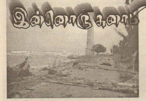
இவ்வாடுகுவா நீலவிருந்தும் நமது இரகக்காலம் விடிகிறது பார் பட்ட மரத்தில் சுற்றி வட்டக் காளான் துளிர் நம்பிக்கையுடனும்