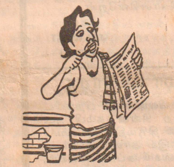
உதைத்தான் ... பொல்லைக் குடுத்து அடி வாங்கிற வேலை என்று சொல்லுறது ... கண்டியனோ.....!

தூறு நிரம்பியதாக அமைந்துள்ளது என்று தெரிவித்து அகில இலங்கைப் பேரரசு காங்கிரஸ் அமைச்சருக்கு எதிராக 50 கோடி ரூபா நஷ்ட ஈடு கோரி வழக்குத் தாக்கல் செய்ய முடிவு செய்துள்ளது. மேற்படி அமைப்பின் செயற்குழு இந்த முடிவை எடுத்துள்ளது.