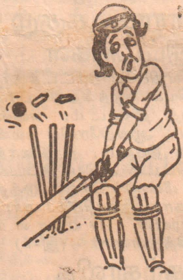
அப்ப ..... தலையீட்டு விவகாரம் தலையிடி விவகாரம் என்று சொல்லுங்கோ .... !

சென்னை வந்திருந்தார். நேற்று மாலை அங்கிருந்து பெங்களூர் புறப்பட்டுச் செல்வதற்கு முன்னர் சென்னை விமான நிலையத்தில் செய்தியாளர்களை பிரதமர் கௌடா சந்தித்தார். அப்போதே இலங்கை இனப்பிரச்சினையைத் தீர்ப்பதற்கான புதிய முயற்சிகள் குஜராலின் இலங்கை விஜயத்தின் பின் மேற்கொள்ளப்படும் என்று அவர் சொன்னார். இந்திய மீனவர்கள் இலங்கைக் கடற்படையினரால் தொடர்ந்து தாக்கப் (8ஆம் பக்கம் பார்க்க)