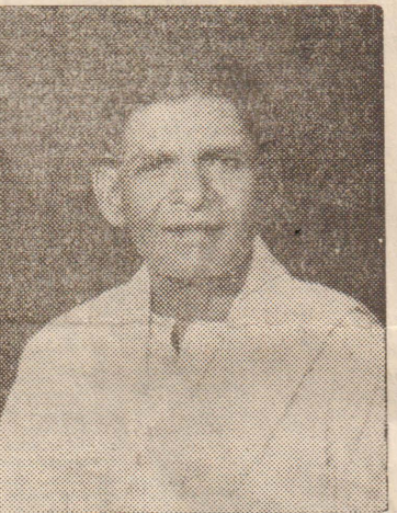
யில் ஈடுபட்ட ஆசிரிய உலகின் மேம்பாட்டுக்கு அயராது உழைத்தார்.

ஆசிரிய தொழிற் சங்கத்தில் ஈடுபாடு கொண்டு அகில இலங்கைத் தமிழ் ஆசிரிய சங்கத்தின் பொருளாளராகவும் யாழ்ப்பாணம் தமிழ் ஆசிரிய சங்கத் தலைவராகவும் இருந்து இருபத்தைந்து வருடங்கள் தொழிற் சங்கத்துறை