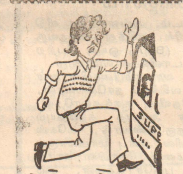
அப்ப இது தொடர்கதை தான் பாருங்கோ.....!