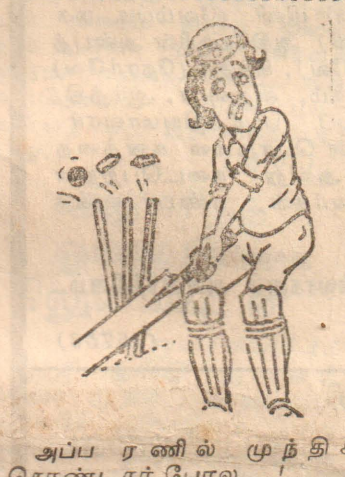
அப்ப ரணில் முந்திக் கொண்டார் போல ...!