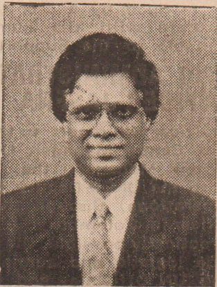
லயன் சித்ரால் அமரதுங்கா ஆளுநர்

சென்ற ஆண்டு வலிகரமம் பகுதிகளில் இருந்து மக்கள் இடம்