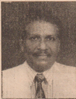
லயன். கே. தில்லைநாதன் உ.ப. ஆளுநர்