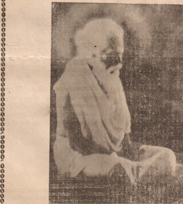
சிவதொண்டன் நிலையத்தில் சேரீர் சிவயோகர் திருவுருவைப் பாரீர் அவதார மகிமையினைத் தேரீர் அவரன்பைப் பெற்றுக் கடைத் தேரீர்!

நல்லூரான் திருவடியை நான் நினைத்த மாத்திரத்தில் எல்லாம் மறப்பேனடி கிளியே இரவுபகல் காணேனடி