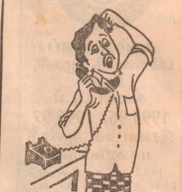
அப்ப ரணில் முந்திக் கொண்டார் போல...!

இன்று காலை 5.00 மணிக்கு ஊரடங்குச் சட்டம் தளர்த்தப்படுவதாக அறிவிக்கப்பட்டது. (இ-5)