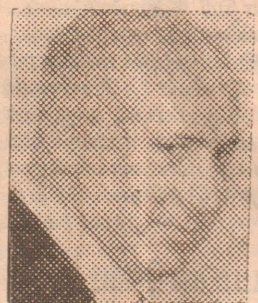
3 மாதானத்துக்கான ஒப்பந்தம் ஒன்றில் கைச்சாத்திடவுள்ளன என்றும் நத்தனியாகு தெரிவித்திருக்கிறார்.

ரெல் அவீவ், மார்ச் 24 ரெல் அவீவ் நகரில் நடத்தப்பட்ட தற்கொலைக் குண்டுத் தாக்குதலைக் கண்டித்துள்ள இஸ்ரேலியப் பிரதமர் நத்தனியாகு ஹமாஸ் இயக்கத்தினரின் இத்தகைய எல்லாத் தாக்குதல்களுக்கும் பலஸ்தீன அதிபர் யஸீர் அரபாத் தே பொறுப்பேற்க வேண்டும் என்று குற்றஞ்சாட்டியுள்ளார்.