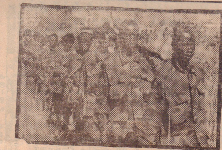
லோறன் கபீலா தலைமையிலான கிளர்ச்சியாளர் கூட்டணியின் படையணி ஒன்று கிழக்கு ஸயரின் கிராமம் ஒன்றில் அணிவகுத்துச் செல்லும் காட்சி.

வாஷிங்டன், மே 15 இந்திய - பா கிஸ்தான் பிரதமர்களுக்கு இடையே இடம் பெற்ற உயர் நிலைப் பேச்சுக் கள் வரலாற்றுச் சிறப்பு வாய்ந்தவை எனவும் அவை குறித்து அமெரிக்கா மிகத் திருப்தியடைந்துள்ளது எனவும் அமெரிக்க வெளியுறவுச் செயலகம் தெரிவித்துள்ளது. தெற்காசியப் பிராந்தியத் திற்கு விரைவில் விஜயம் செய்ய அமெரிக்க வெளியுறவுச் செயலர் மடலின் ஆல் பிறைற் விரும்புவதாகவும் தெரிவிக்கப்பட்டது. (ஐ-10)