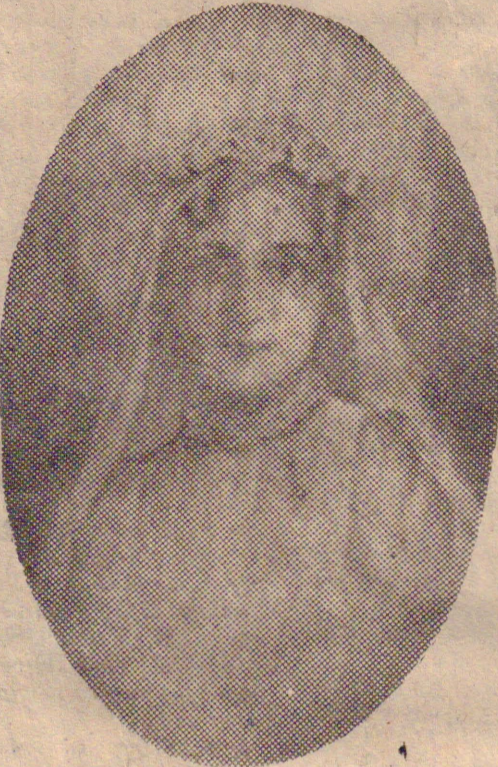
கல்லூரியின் பாதுகாவலியாக விளங்கும் இயேசுவின் சிறிய புஷ்பம் புனித திரேசாள் ரோஜா மலர்களைப் பொழியட்டும்!