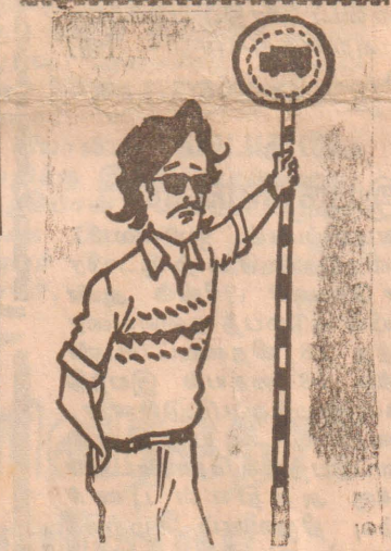
அப்ப படையினரின் தரை வழிப் பாதை என்னவாம்...!