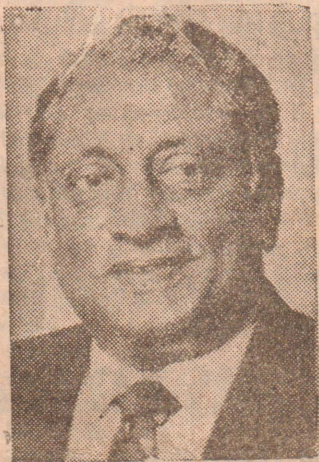
அமைச்சர் கதிர்காமர் மேலும் கூறியிருப்பதாவது: பேச்சுவார்த்தையை ஆரம்பிப்பதற்கான நம்பிக்கைத் தன்மையுடைய - அணுகு (8 ஆம் பக்கம் பார்க்க)

புதுடி, ஜூலை 29 சமாதானப் பேச்சுக்கான கதவு திறந்தே உள்ளது. அதேசமயம் வடக்குக்கான தரைப் பாதையைத் திறக்கும் நடவடிக்கைகளிலும் அரசு முன்னோக்கிச் சென்று கொண்டிருக்கின்றது.