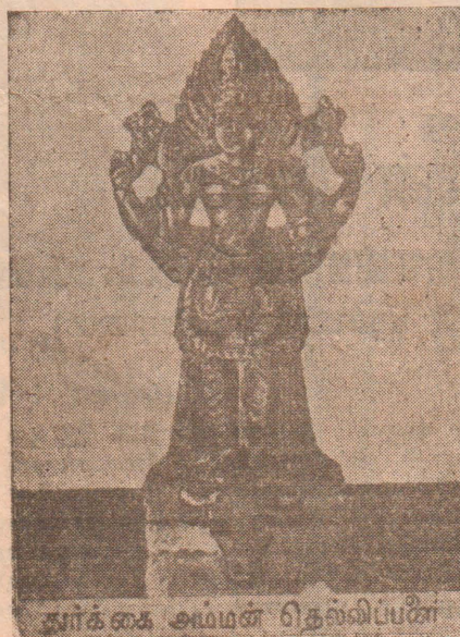
துர்க்கை அம்மன் தெல்லிப்பழை