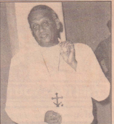
டையில் நடைபெறும் பேச்சுவார்த்தையின் உள்நோக்கமொன்றை தந்துள்ளார். பேச்சு வார்த்தையின் ஆரம்பக் கூட்டத்தில் தோற்கடிக்கப்

வில்லை. மற்றைய மதத்தைச் சேர்ந்த எமது சகோதர சகோதரிகள் கூட, சகல மதங்களும் ஒன்றே கட்டாயப்படுத்திக்கூற மாட்டார்கள் ஒத்துழைப்பினால் அனைத்து மதங்களினதும் நற்பணி தடுத்தவைக்கப்பட முடியாது என்றும் ஏற்றுக்கொண்டுள்ளார்கள். எனவே இப்படியான பாடுபாடுகள் உரையாடலையும் ஒத்துழைப்பையும் அதிக அக்கறை கொண்டதாகவும் அறை கூவல் விடுவதாகவும் வெகுமானம் அளிப்பதாகவும் ஏற்படுத்தும்.