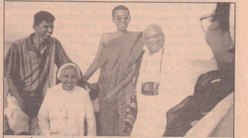
புசல்லாவை சர்வமத ஒன்றியம் மகிழ்ந்திருக்கையில்....

அதாவது சிறுவர்களுக்கு எதிராக நடைபெறுகின்ற வன்முறைகளை குறித்து கவனம் செலுத்தி அவற்றில் இருந்து மீள்வதற்கு வழிசெய்தல், சிறுவர்களை பாலியல் துஷ்பிரயோகத்தில் ஈடுபடுத்தல், கல்வியை கொடுக்க மறுத்தல், கடினமான வேலைகளை சுமத்தல், போதைவஸ்துக்கு அடிமையாக்குதல் இந்த மாதிரியான தீமைகள் சமூகத்தில் நடைபெற்றுக் கொண்டு இருக்கின்றது.