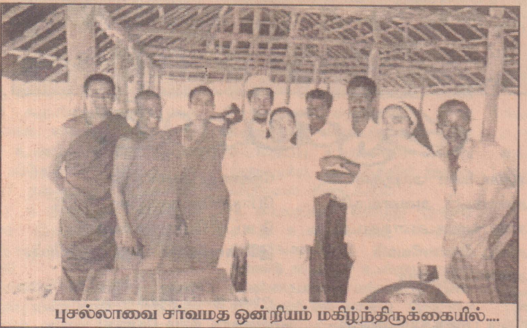
புசல்லாவை சர்வமத ஒன்றியம் மகிழ்ந்திருக்கையில்....

கண்டிப் பகுதியில் உள்ள புனித திருத்துவக் கல்லூரியை எடுத்தால், இது அங்கிலிக்கன் சபைக் கல்லூரி. இதில் கல்வி பயிலுபவர்கள் பெரும் துறையாளர் பிள்ளைகளும், பணக்காரப் பிள்ளைகளும் தவிர, சாதாரண தோட்டத்