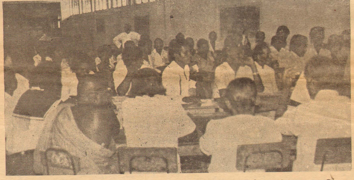
அபிப்பிராயங்கள், யோசனைகள் உதயமாவது பற்றி கலந்துரையாடுகின்றனர்.

புளரமைப்பு செயற்றிட்டங்களில் 10 ஆண்டு காலம் முடி