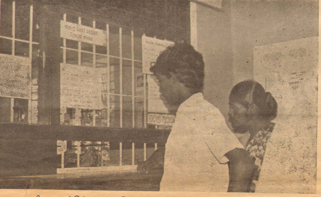
நிறுவனத்தில் சமூக சேவைப்பயிற்சி நடைபெறுகின்றது.

எனினும் அங்கத்தவர்கள் அரசாங்கத்தின் சார்பிலும் கிராமியமட்டத்தில் அபிவிருத்தித் திட்டங்களில் பங்கு கொண்டு தமது சக்தியையும் ஆர்வத்தையும் செயற்திட்டத்தில் முற்றும் முழுதாகக்காட்டி செயற்பட்டு வெற்றியை அடையவேண்டும்.