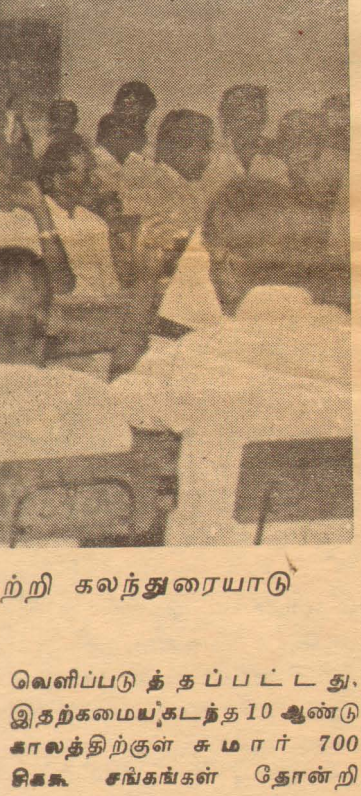
சமூகமளிப்பதனால் சமாதானம், ஒற்றுமை வளர்வ

வாங்கல்களில் ஈடுபடுத்தலுக்கு பதிலாக 1978-ம் ஆண்டு புளரமைப்புக்குப் பின்னர் விசுவாசம் பாதுகாப்பு ஆகியவற்றை உறுதிப்படுத்திக் கொண்டு உறுதியான ஒரு நிதி முகாமை செய்யக் கூடிய ஒரு சிறந்த அமைப்பு என்பது