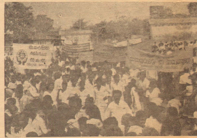
சமூகமளிப்பதனால் சமாதானம், ஒற்றுமை வளர்வ

ஒரு சர்வ கலாசாலையினுள்ளோ அல்லது ஒரு வகுப்பறையினுள்ளோ இருந்து கொண்டோ திட்டம் வகுக்கும் முறைக்குப் பதிலாக கிராமிய மட்டத்தில் இருந்து கொண்டு திட்டமிடுதலின் முக்கியத்துவத்தினை விளங்கிக் கொண்டு அதற்கான பயிற்சி அளிக்கக் கூடிய ஒரு சிறந்த அமைப்பாக விளங்குகின்றது. இதனால் கிடைக்கக் கூடிய முதல் நன்மையாக தெனில் மக்களின் உண்மையான தேவை யாதென்பதைப் பற்றி அவர்களது கருத்தைப் பெற்றுக் கொண்டு அக் கருத்தை மையமாகக் கொண்ட குழுக்கள் உருவாகி இம் முயற்சியின் குறிக்கோளை இலக்காகக் கொண்டு செயற்பட வைத்தலே ஆகும்.