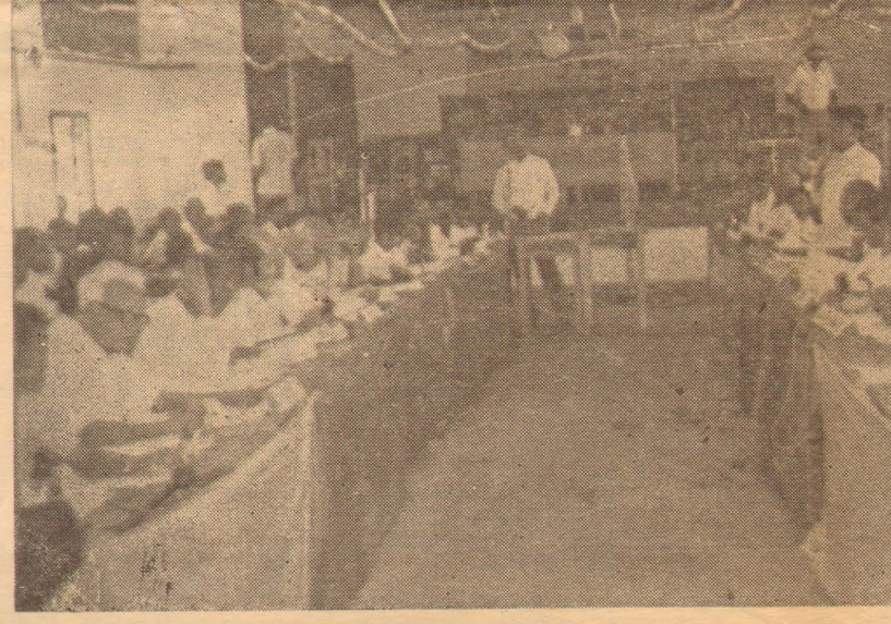
திறமை முன்னேற்றத்துக்கு முதல் இடம் கிடைக்க

யதாக உள்ளது. எனவே 1978ம் ஆண்டிற்கு முன்னர் செயற்படுத்தப்பட்டு வந்த சம்பிரதாயமான நடைமுறைகளாகிய மாதம் ஒரு முறை செயற்பாடுகளிலும், நிதிக்கொடுக்கல்