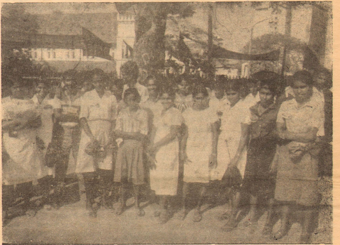
மார்ச் 5 நடவடிக்கைகளில் கலந்து கொண்ட சிஎம்யு பெண் உறுப்பினர்களில் ஒரு பகுதியினர்

வடக்கில் இன்று நிலவும் பயங்கர நிலைமையை அலட்சியம் செய்து இத்தினத்தில் இவர்கள் இத்தகைய நடவடிக்கையொன்றில் ஈடுபட்டதையிட்டுத் தனது பாராட்டுதல்களைத் தெரிவிக்கும் தீர்மானம் ஒன்றையும் 26/3/87 கூடிய பொதுச்சபை நிறைவேற்றியது.