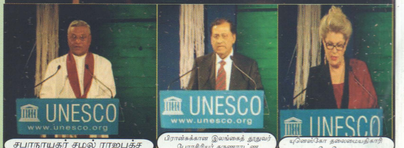
சபாநாயகர் சமல் ராஜபக்ச