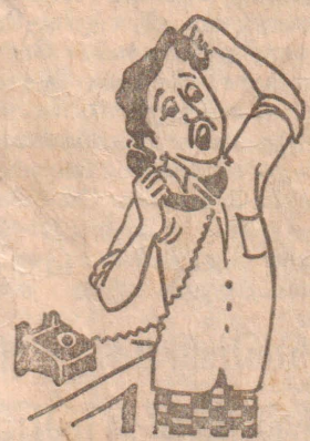
அப்ப அடுத்த முறை கவிழ்க்க முந்தி உழைச்சிடலாம் போல.....!

இவற்றையொட்டி புலிகள் பெருந்தாக்குதலை நடத்தலாம் என தகவல் கிடைத்துள்ளதாக படை வட்டாரங்கள் தெரிவிக்கின்றன. எந்த ஒரு தாக்குதலையும் முறியடிக்கும் வகையில் படையினர் உஷார் நிலையில் வைக்கப்பட்டுள்ளனர். பாதுகாப்பு (8 ஆம் பக்கம் பார்க்க)