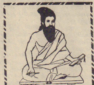
இன்று வள்ளுவர் குருபூசை நாள்

பெண் ஆடம் மனிதர்களிடத்தில் உடன்பிறந்த நேயமுடன் பழகுவேன் என்ற ஒரு வரியை மட்டும் எழுதிக் கொள்! என்று கூறிவிட்டு உறங்கி விட்டான். தேவதையுப் மறைந்து விட்டான். மறுநாள் இரவு; அதே