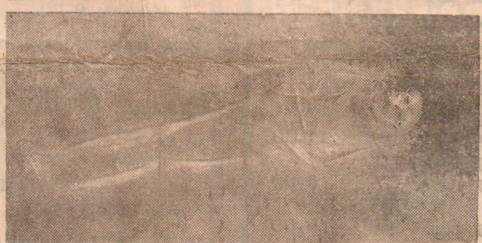
யாழ். துரையப்பா [ஸ்ரேடியத்தில் நேற்று இடம்பெற்ற அகழ்வுப்பணிகளை யாழ். மேலதிக நீதிவான் எஸ். ஏ. ஈ. ஏகநாதன் மேற்பார்வை செய்வதை முதலாவது படத்தில் காணலாம். புதைகுழியில் இருந்து முழுமையாக மீட்கப் பட்ட எலும்புக்கூடு இரண்டாவது படத்தில் காணப்படுகிறது.